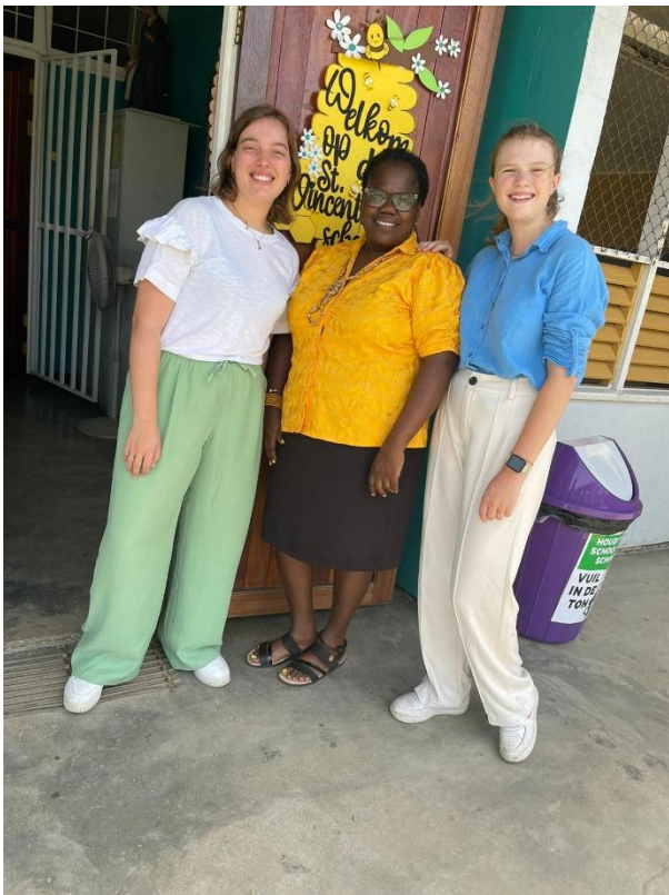
Foto met het schoolhoofd.